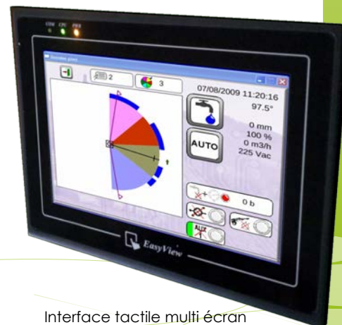
Interface tactile multi écran côté pivot (ou rampe)