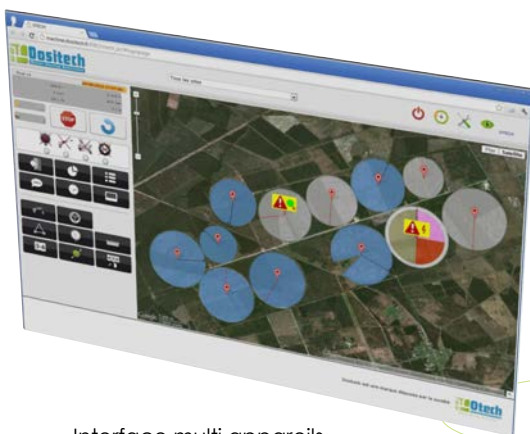
Interface multi appareils côté ordinateur

Dositech permet de gérer un pivot ou une rampe frontale fonctionnant sur 10 secteurs maximum, dont les doses d'eau à apporter par passage sont différentes. Le Dositech permet la surveillance et la programmation à distance de vos appareils connectés au réseau GPRS.