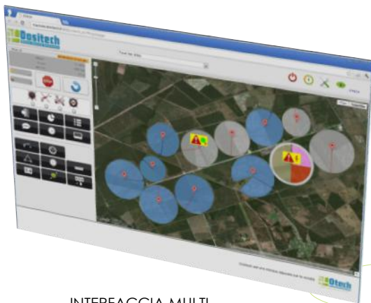
INTERFACCIA MULTI PIATTAFORMA SU PC

Dositech permette di gestire un pivot oppure una rampa frontale lavorando su un massimo di 10 settori, con una diversa gestione idrica per passaggio e per sito. Dositech permette di sorvegliare e programmare a distanza tutti i vostri Pivot e Rampe frontali tramite collegamento GPRS.