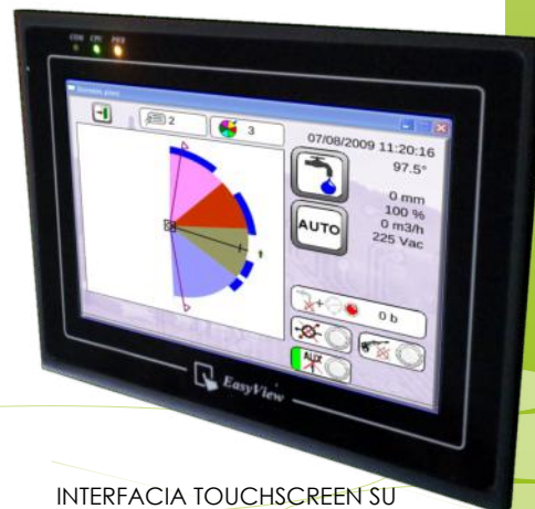
INTERFACCIA TOUCHSCREEN SU PIVOT O RAMPA